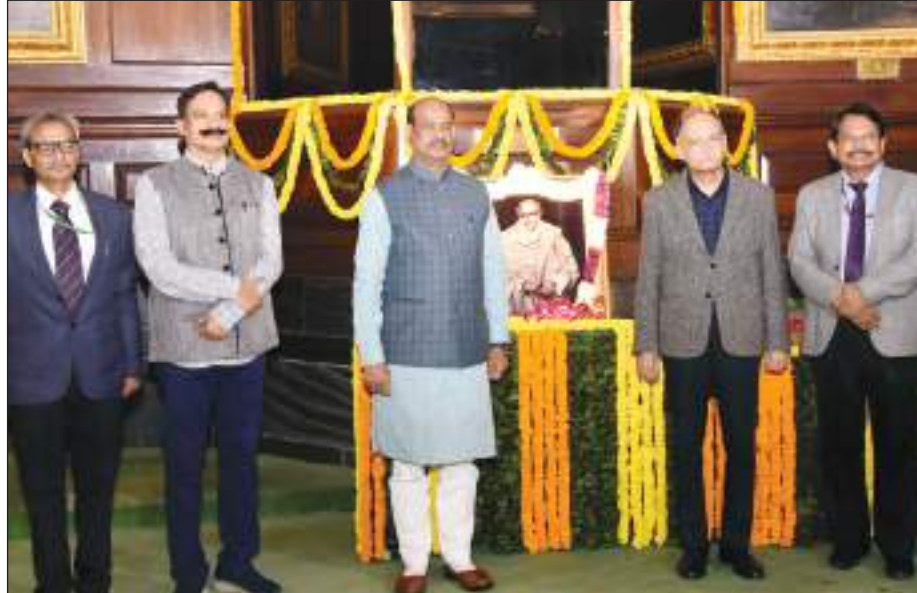
नई दिल्ली में लोकसभा अध्यक्ष ओम बिरला ने संविधान सदन के सेंट्रल हॉल में स्वतंत्र भारत के पहले भारतीय गवर्नर जनरल सी. राजगोपालाचारी को उनकी जयंती के अवसर पर श्रद्धांजलि अर्पित की।

करोड़ से ज्यादा लोगों को पिछले 5 वर्षों से प्रतिमाह मुफ्त अनाज दिया जा रहा है। यह अनाज अगले 5 वर्षों तक इसी प्रकार मुफ्त में मिलता रहेगा। इस पर लगभग 12 लाख करोड़ रुपए का खर्च आया। मोदी सरकार पूरे देश में किसी भी गरीब को भूखा नहीं रहने देगी। आज पूरे देश के 11 करोड़ से ज्यादा किसानों को सालाना 6000 मिलते हैं।" श्री ठाकुर ने आगे कहा, "मोदी सरकार ने पेट्रोल और डीजल के दाम दो बार कम किए हैं। जब हिमाचल प्रदेश में भारतीय जनता पार्टी की सरकार थी तब राज्य सरकार ने भी दो बार दाम कम किए थे। मगर जैसे ही राज्य में कांग्रेस की सरकार बनी वैसे ही दो बार दाम बढ़ा दिए गए। यह स्पष्ट अंतर है। ठाकुर ने आगे बताया कि जब वह राजस्थान में चुनाव प्रचार हेतु गए थे तब श्रीगंगानगर में उन्हें पेट्रोल के दाम 118 रुपए प्रति लीटर मिले। "यह कांग्रेस हर जगह करती है। राजस्थान हो या छत्तीसगढ़, हर जगह कई पेंपर लीक के मामले सामने आए।