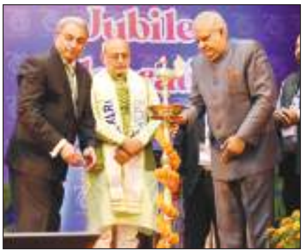
उपराष्ट्रपति और सभापति झारखंड के जमशेदपुर में एक्सएलआरआई-जैवियर स्कूल ऑफ मैनेजमेंट के लॉन्चिंग समारोह में दीप प्रज्वलित करते हुए।